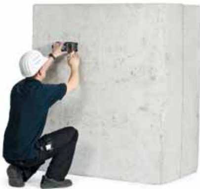
Feststellen der im Bauteil vorhandenen Bewehrung mittels Bewehrungsscanner

Wir bieten unsere technische Kompetenz als Dienstleistung an und entwickeln innovative Lösungen und Produkte für den Hoch-, Tief- und Infrastrukturbau. Ein Beispiel aus unserer Palette an Eigenentwicklungen ist der HOCHTIEF-Schwerlastanker – eine hochleistungsfähige Lösung für außerordentliche Kräfte im Kraftwerks- und Industriebau.