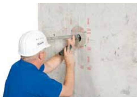
Kontrolle des fertigen Hinterschnitts mit spezieller Lehre