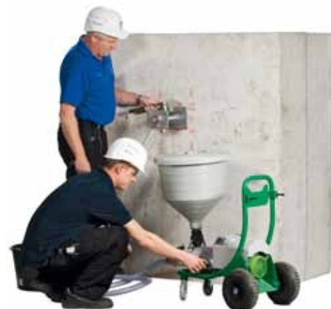
Verpressen des Ankers über die Zuführung im Montagebehelf mit spezieller Mörtelpumpe