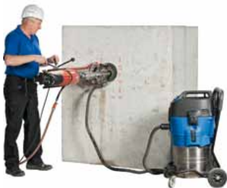
Rote Markierungen zeigen die Bewehrungslage an. Schonen der Bewehrung durch Herstellen der Kernbohrung zwischen den Bewehrungsstäben.

Bisher weisen handelsübliche Schwerlastdübel eine zulässige Zugtragfähigkeit von wenigen Tonnen auf. Der Bedarf für die nachträgliche Befestigung sehr hoher Kräfte in Betonbauteilen ist im gesamten Industrie- und Anlagenbau vorhanden. Sofern große Anlagenteile und Maschinen zu befestigen sind, reicht die maximale Zugtragfähigkeit von Standardbefestigungen nicht aus. Zunehmend müssen solche Anlagen an neue technische Entwicklungen angepasst und umgerüstet werden. Daher hat HOCHTIEF Consult die Entwicklung seines Schwerlastankers HT-SHV intensiv vorangetrieben.