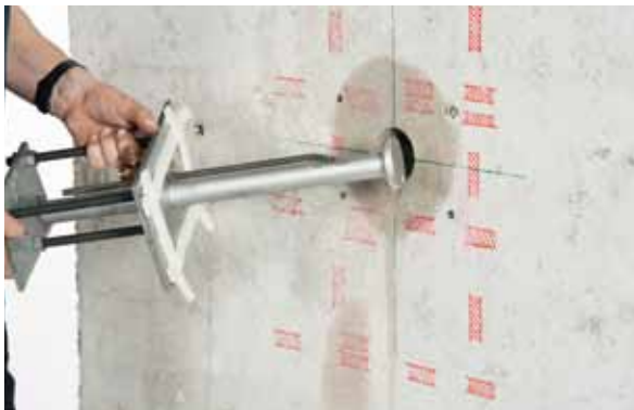
Einsetzen des auf dem Montagebehelf lagegenau fixierten Ankers ins Bohrloch