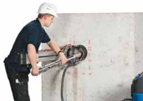
Einführen des Hinterschneidekopfs in die Kernbohrung

Eine Vielzahl weltweit durchgeführter Versuche belegt die Wirkungsweise von Verankerungen wie Kopfbolzen und Dübeln im Beton. Die so einleitbaren Lasten decken jedoch lediglich den niedrigen bis mittleren Lastbereich ab. Für hohe Zugkräfte, die nachträglich in bestehende, nur von der Anschlussseite zugängliche Betonbauteile eingeleitet werden müssen, sind alternative Lösungen notwendig. Eine attraktive und wirtschaftliche Lösung hierfür können spezielle, für hohe Lasten entwickelte Anker sein. Diese werden insbesondere dann benötigt, wenn einbetonierte Verankerungen fehlen. Um langwierige und kostenintensive Vorplanungszeiten für einbetonierte Verankerungen einzusparen, kann es oft sehr vorteilhaft sein, auf bedarfsgerechte, nachträgliche Verankerungen zu setzen. Der HOCHTIEF-Schwerlastanker eröffnet hierzu ganz neue Möglichkeiten.